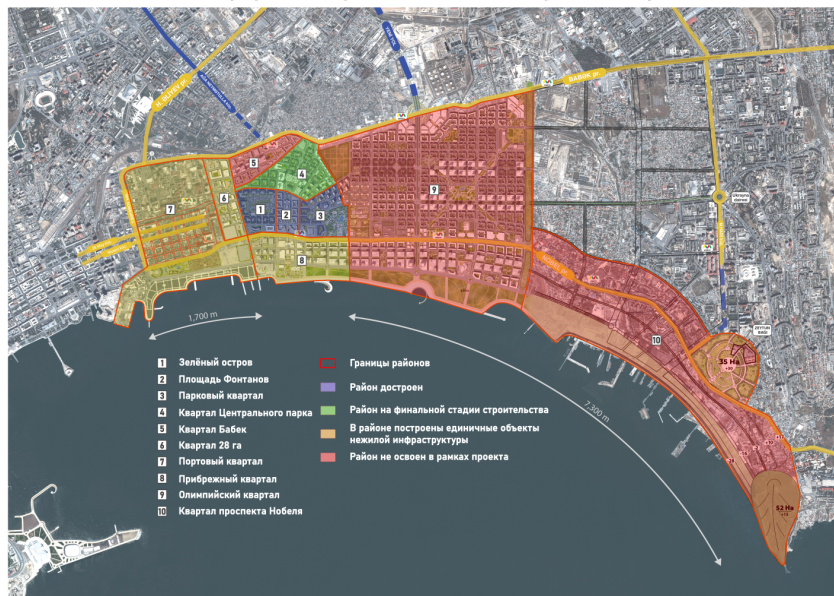
Рисунок 2 – Завершенность строительства внутренних районов Белого города Баку. Составлено авторами

Анализ коммерческого разнообразия подтверждает символическую функцию района. Представлены лишь 2 основных категории: заведения общественного питания и магазины для строительства и ремонта (рис. 4). Практики в кафе копируют общий мотив «парижских» кварталов: люди приходят сделать красивые фото для социальных сетей. Главные места концентрации расположены вдоль центральной оси района и его лицевой части в сторону моря.