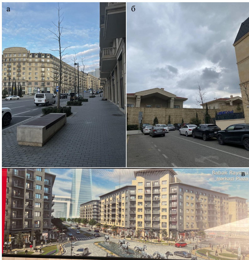
Рисунок 3 – а) «Парижские» кварталы, б) «Gated community» внутри района, в) архитектурный рендер, размещенный в подземном переходе.

малоэтажного поселка Кешла. Самая резкая граница находится с востока, где находящийся на возвышенности Белый город отгорожен высокой стеной и трубами от расположенной в низине Кешлы (рис. 5). Так барьерные объекты фиксируют статусную и имущественную геотеротопию, превращая символические объекты в подобию «белых городов» Средневековья [Терборн, 2021]. Они также огорожены со всех сторон рвами-автомагистралями и стенами, отделяющими высшие сословия от низших, живущих в низине, под стеной.