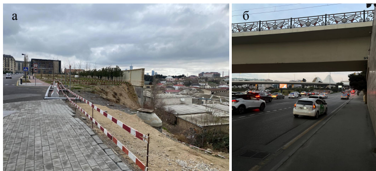
Рисунок 5 – Барьерные объекты: а) стена между Белым городом и поселком Кешла; б) барьерные магистрали вокруг центра Гейдара Алиева.

велось застройщиком DIA Holding. Ранее на месте центра располагалась промышленная зона. Объект также находится на оси барьерного проспекта Гейдара Алиева, пересечь который пешеход может только с помощью подземного перехода (рис. 5б) .