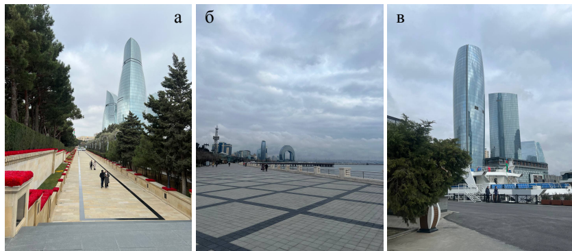
Рисунок 1 – Новый образ Баку:

а) Аллея Шахидов и Пламенные башни; б) перспектива бульвара; в) новые деловые центры на набережной.